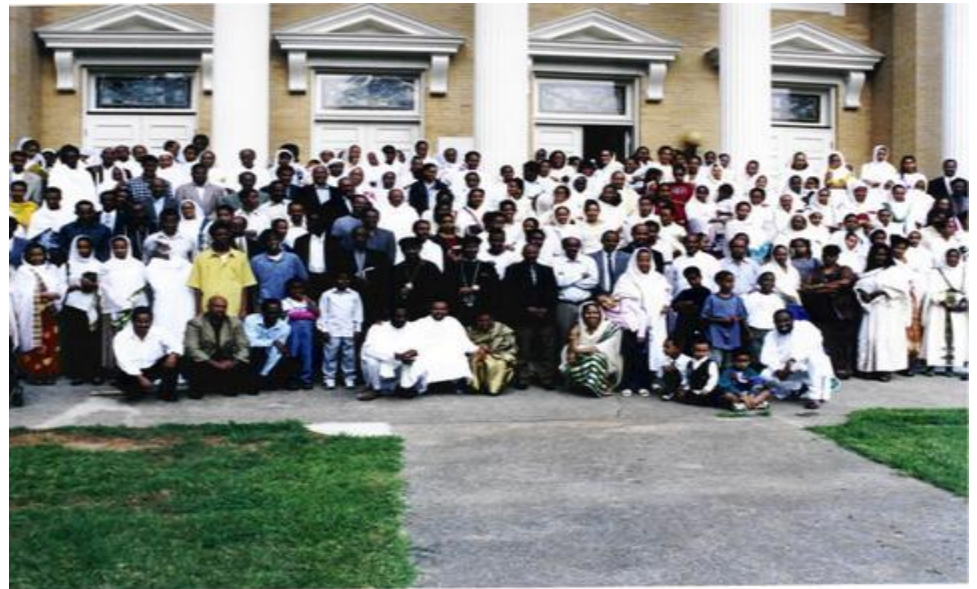
Conference of Eritrean Orthodox Church N. America Aug 3-6, 2000 Atlanta, Georgia